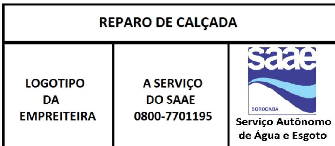
Desenho 1: Identificação Lateral de caminhões/veículos/máquinas

Antes da identificação dos veículos para realização da vistoria, verificar junto à Fiscalização do SAAE qual o logotipo atualizado. Seguir criteriosamente as cores mostradas nos desenhos.