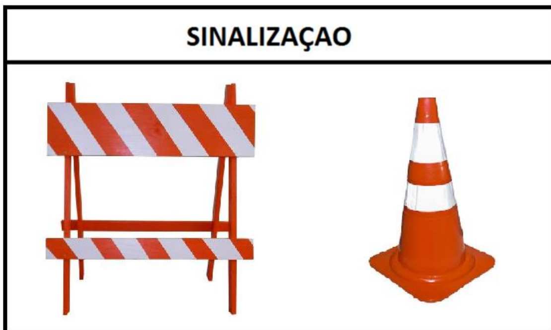
Desenho 2: Modelos de Placas e/ou Cones de sinalização

Antes da identificação dos veículos para realização da vistoria, verificar junto à Fiscalização do SAAE qual o logotipo atualizado. Seguir criteriosamente as cores mostradas nos desenhos.