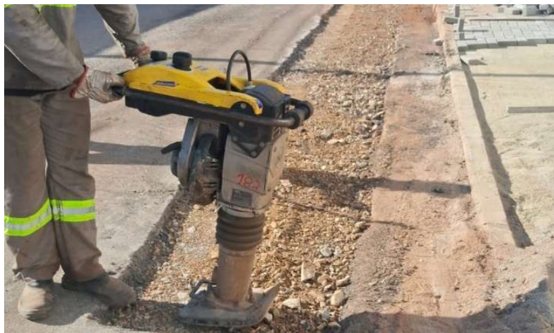
Compactação da vala.

4.2. Nas valas e/ou buracos recebidos pela CONTRATADA total ou parcialmente aterrados (devido às exigências do local ou outras situações que recomendassem o seu aterramento imediato), a CONTRATADA deverá avaliar as condições do reparo, e adotar procedimentos necessários que garantam a qualidade e durabilidade exigidos. Para isto a CONTRATADA deverá retirar do interior do reparo todo material inadequado para o aterro, e posteriormente deve aterrar e compactar a vala com material de qualidade, importado de área de empréstimo indicada pelo SAAE.