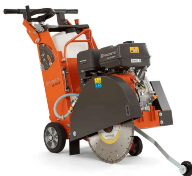
Cortadora de piso com disco diamantado.

1.5. Máquina de cortar asfalto com disco diamantado de 350 mm.