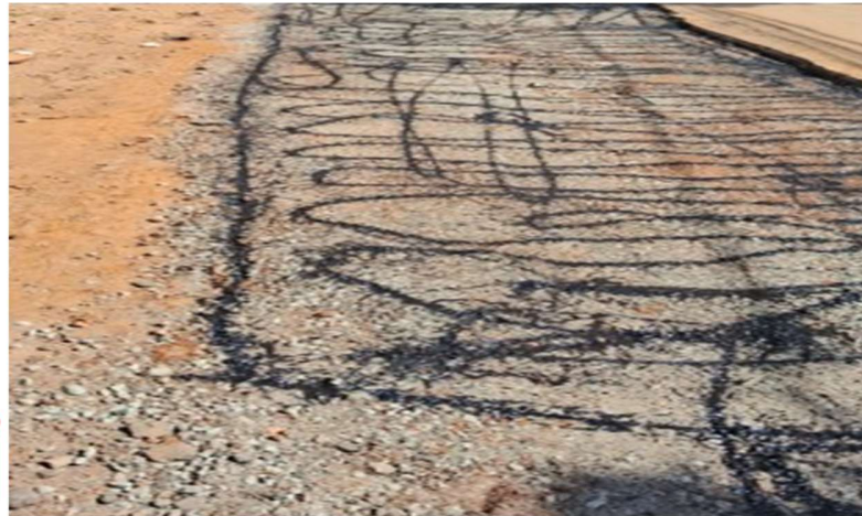
Pintura de ligação aplicada de forma irregular.