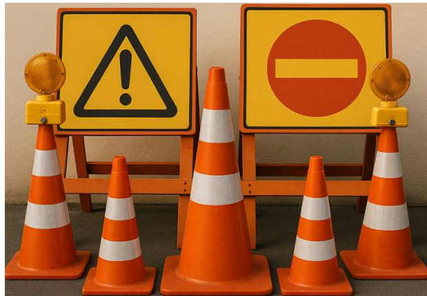
Conjunto de sinalização.

1.10. Conjunto de sinalização, composto de cones, cavaletes, placas de advertência e etc.