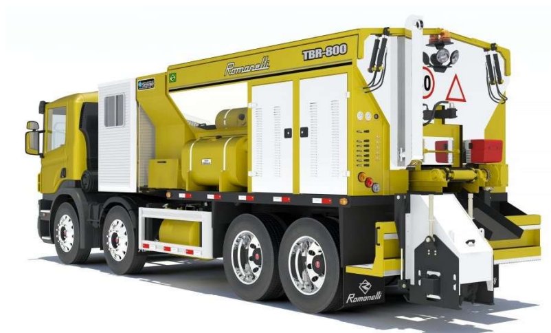
Caminhão com caçamba térmica.

1.2. Rolo compactador vibratório Tandem Dynapac, modelo CC900, ou similar, de 1,0 a 1,9 toneladas, com carreta de transporte.