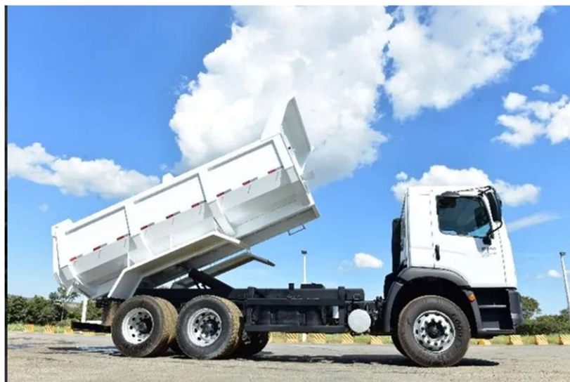
Caminhão basculante trucado.

1.7. Compactador de percussão para valas e solos coesivos, de no mínimo 58kg, com motor a gasolina ou outro sistema alternativo.