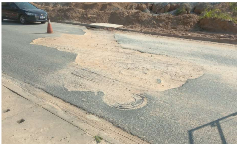
Corte não realizado de forma retilínea.