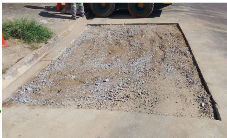
Corte retilíneo e uniforme.