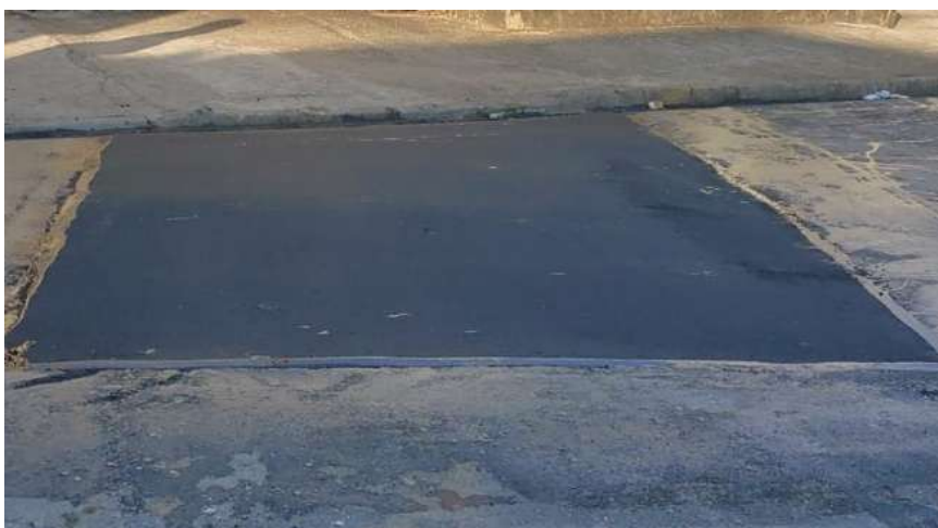
Acabamento nivelado entre o reparo e o pavimento existente.

8.2. Reparar defeitos superficiais se houver.