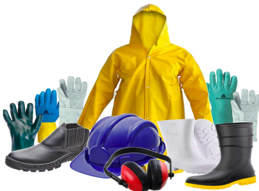
Equipamentos de proteção individual.