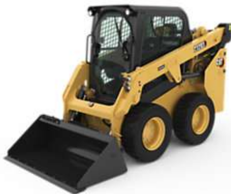
Mini pá carregadeira.

1.4. Placa vibratória Dynapac, modelo lf-81, ou similar.