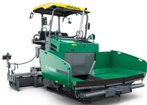
Vibro acabadora de asfaltos sobre esteiras.

1.8. Vibro acabadora de asfalto sobre esteiras, com potência máxima de 105 CV, capacidade até 300 ton., com operador.