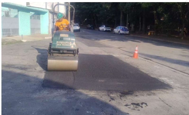
Compactação da massa no sentido longitudinal.

7.5. A placa vibratória deve ser utilizada apenas em locais de difícil acesso para o rolo compactador ou em vias muito íngremes.