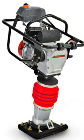
Compactador de percussão para valas e solos.

1.7. Compactador de percussão para valas e solos coesivos, de no mínimo 58kg, com motor a gasolina ou outro sistema alternativo.