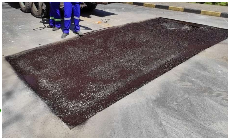
Pintura de ligação aplicada de forma uniforme em toda a área da caixa.