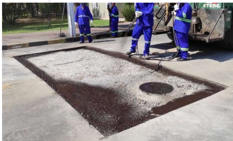
Aplicação da pintura de ligação através da caneta espargidora.