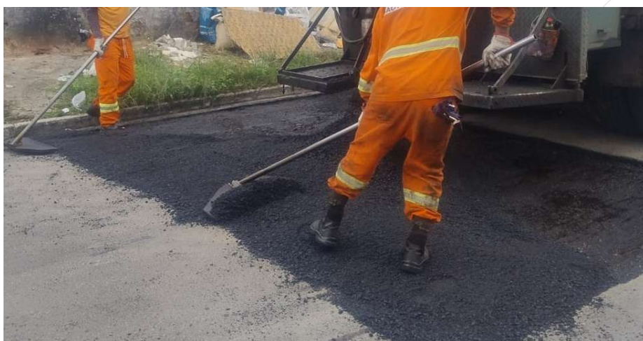
Espalhamento de massa asfáltica utilizando rastelos e a bica direcionadora do caminhão térmico.

6.3. Caso haja a necessidade de correção na superfície da camada de asfalto, ela deve ser feita por meio de adição manual de massa asfáltica, com o objetivo de obter o melhor nivelamento possível.