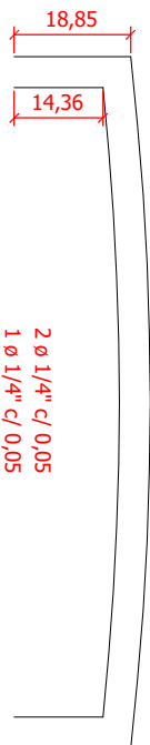
ARMAÇÃO / GUIA CHAPÉU ESCALA: 1:10 OBS: MEDIDAS EM CENTÍMETROS